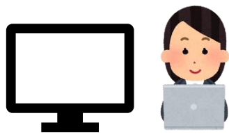
健康保険組合担当者 BLP担当者