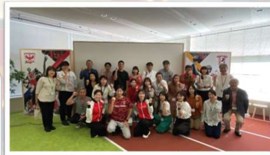
※Fujitsu Sports杯 開会式の様子

みんなで歩活 2023秋 ×Fujitsu Sportsイベントご報告（12/12更新）（sharepoint.com）