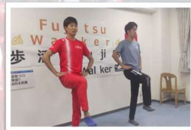
※ウォーキング教室の様子