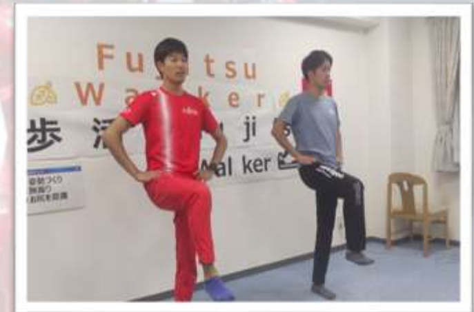
※ウォーキング教室の様子