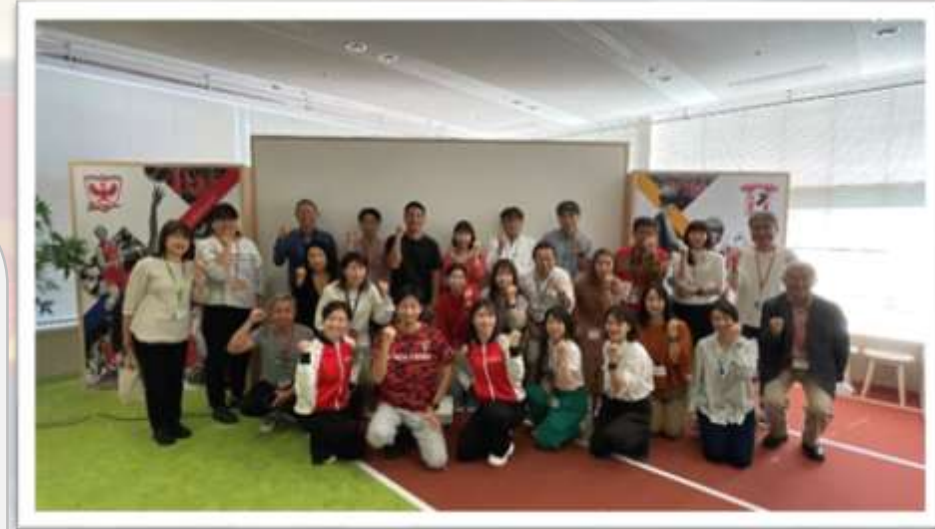
※Fujitsu Sports杯 開会式の様子

みんなで歩活 2023秋 ×Fujitsu Sportsイベントご報告（12/12更新）（sharepoint.com）