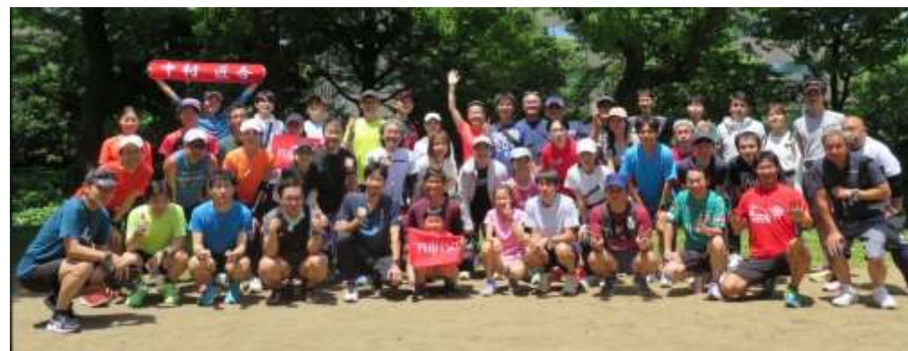
※24年春「 皇居Run & Walk 」集合写真